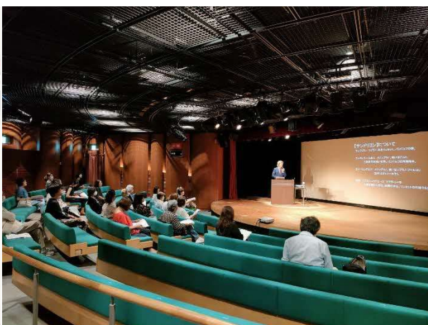
8/29 関西歌劇団オペラレクチャー (小ホール)