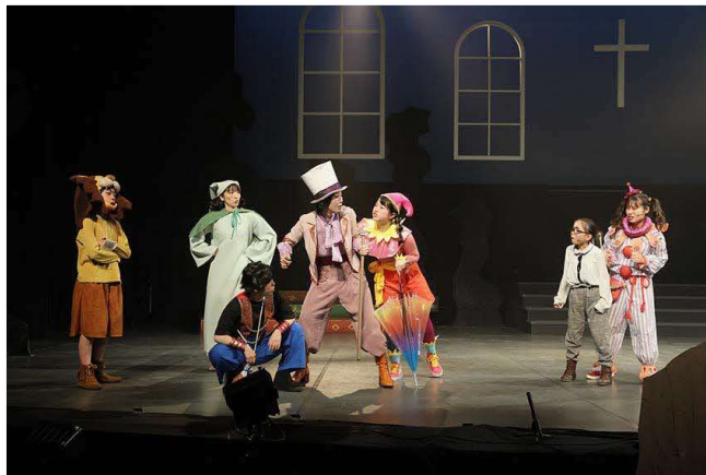
3/23 ファミリーミュージカル (中ホール)