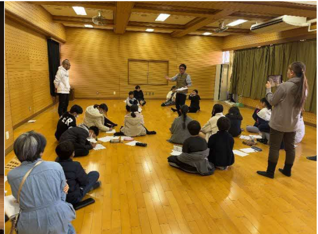
12/20 演劇ワークショップ (小学校)