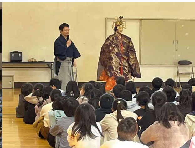
11/30 はじめての能ワークショップ（小学校）