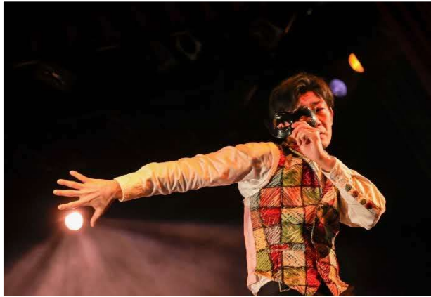
2/2 怪人二十面相伝 (小ホール)