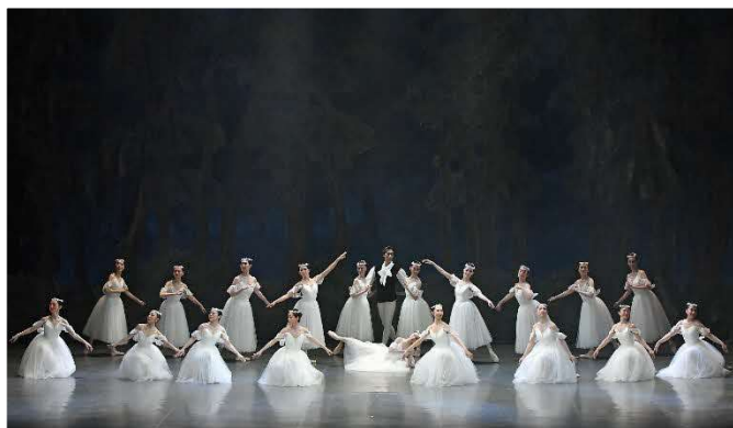
5/28 バレエ公演 (大ホール)