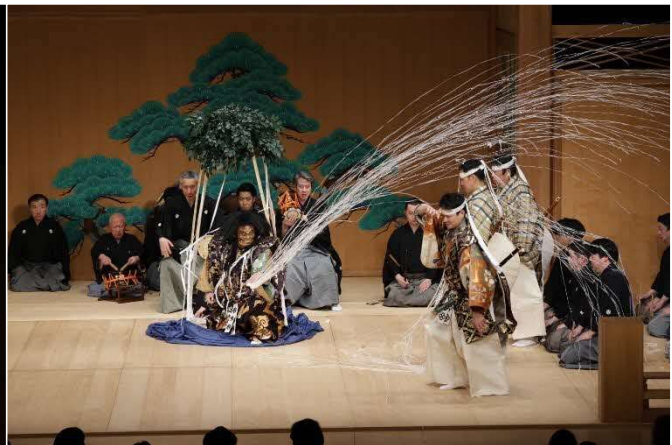
1/14 新春能 (中ホール)