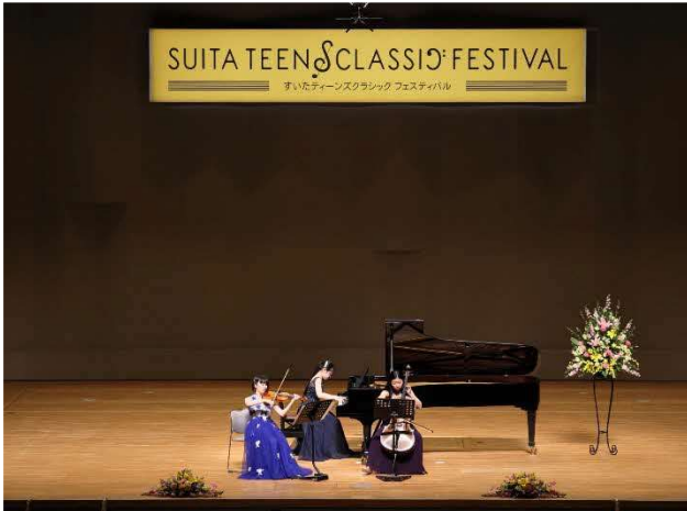
12/17 ティーンズクラシックフェス本選 (大ホール)