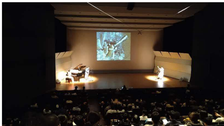
10/29 ポラリス国際音楽祭（中ホール）