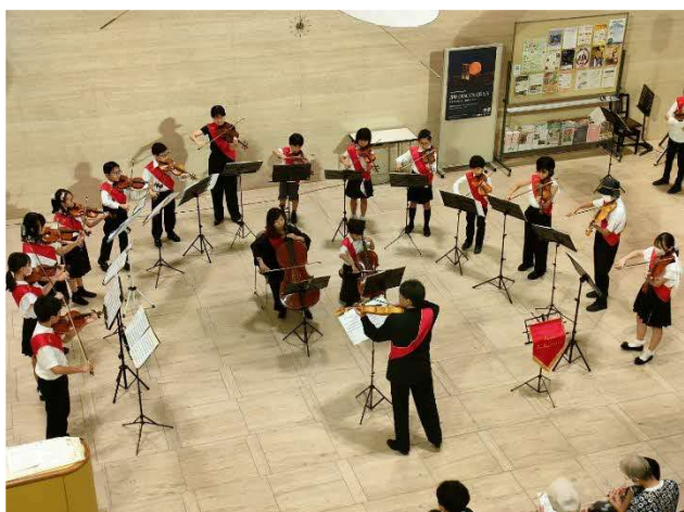
8/20 ロビーコンサート (1F ロビー)