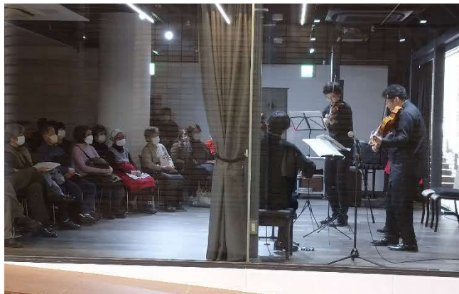
3/7 弦楽四重奏団 (SUITA×ART)