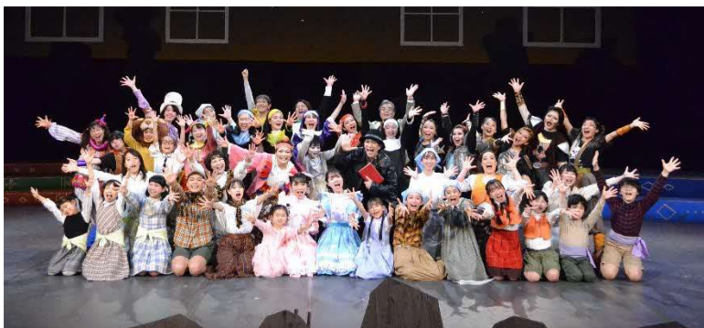
3/23 ファミリーミュージカル (中ホール)