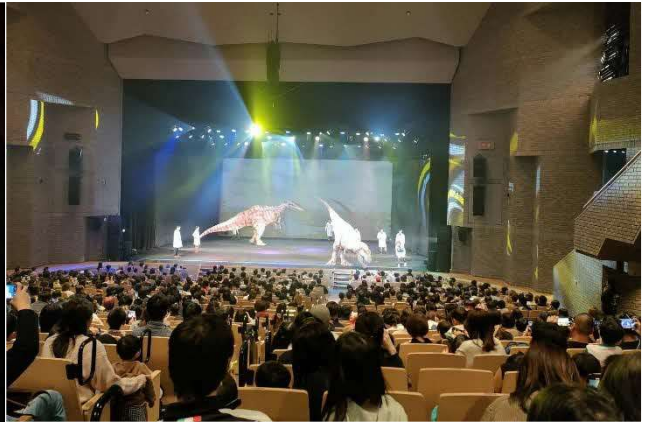
2/17 恐竜ラボ (大ホール)