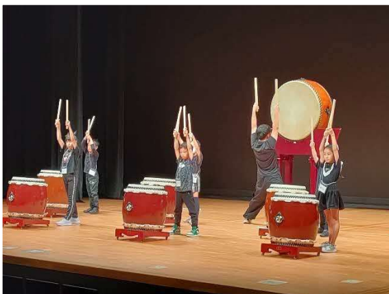
10/6 和太鼓ワークショップ (中ホール)