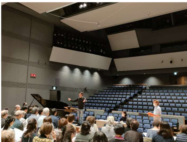
11/9 第九合唱レッスン（中ホール）