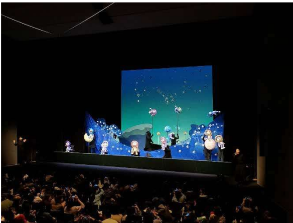
1/8 人形劇団クラルテ (中ホール)