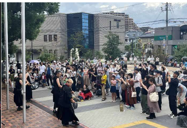
10/1 公園ライブ (いずみの園)