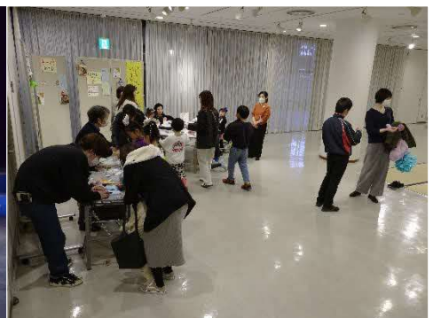
3/25 すいすいまつり (展示室)