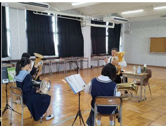
11/3 プラスクリニック（中学校）