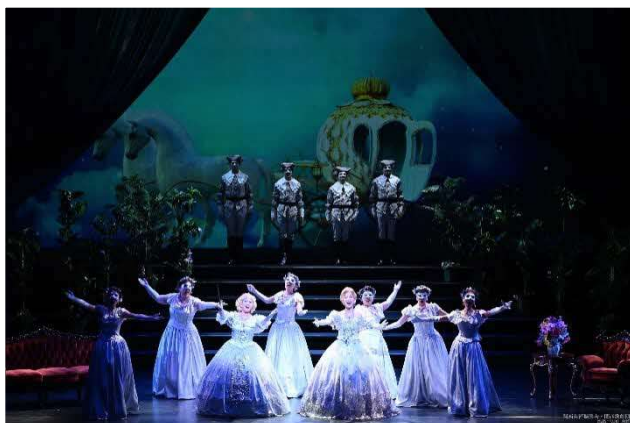
9/16 関西歌劇団 (大ホール)