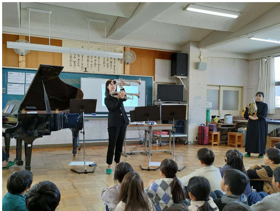
12/7 出張コンサート（小学校）