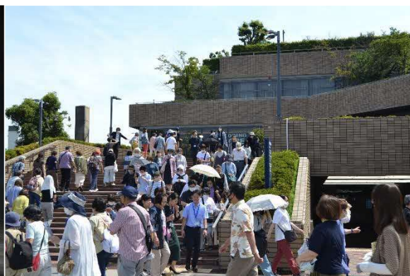
7/4 防災コンサート (中ホール)