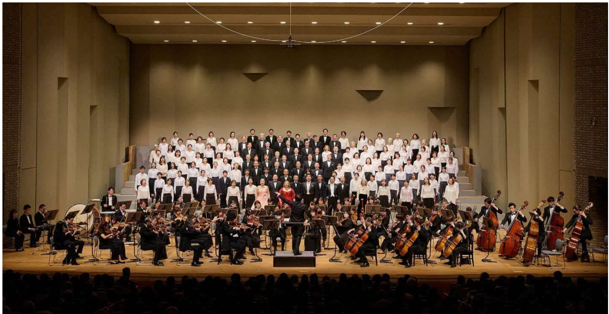
12/24 吹田市民の第九 (大ホール)