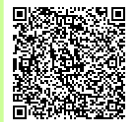
大阪府行政オンラインシステム （制度・提出書類なども記載）

上記補助金の相談窓口を開設しています。 おおさかスマートエネルギーセンター まで