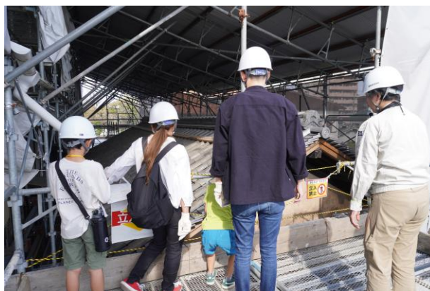
旧西尾家修理工事現場見学会

また、令和6年（2024年）10月24日及び26～27日に修理工事現場見学会を実施しました。