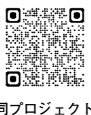
同プロジェクトホームページ

千里ニュータウンの公園を活用し、屋外で「パディントン」を上映します。日本語吹き替え、日本語字幕あり。申し込みなど詳しくは、同プロジェクトホームページへ。時4月27日(出)午後6時30分～8時。雨天時は翌日に延期。所千里中央公園。定先着300人。¥500円。☎計画調整室(☎4860・6217 FAX6368・9901)。