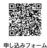
申し込みフォーム

訓練を受けたセラピー犬と一緒に絵本を読みます。時5月3日(金・祝)午後2時～3時。所北千里地区公民館。対おむね6歳～小学生と保護者。定10組。多数抽選。申4月10日(水)午前10時～22日(月)に申し込みフォームへ。☎まちなかリビング北千里(☎6834・2921 FAX6155・8278)。