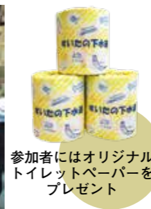
参加者にはオリジナルトイレットペーパーをプレゼント

時5月18日(土)。①午前10時〜11時30分、②午後1時30分〜3時。①は親子向け、②は大人向けの内容です。所南吹田水再生センター。対小学生以上。小学生は保護者同伴。定各30人。多数抽選。申4月14日(日)までに。閩水再生室(南吹田5 TEL 6369・1606 FAX 6369・5150)。