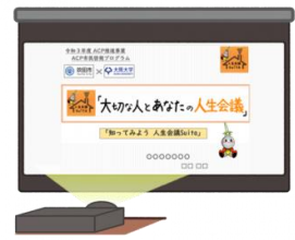
パワーポイント スライド資料

講演会や講座等で使っていただけるパワーポイントスライド。大阪大学監修の内容であり、誰でも効果的な市民啓発が実施できる内容。