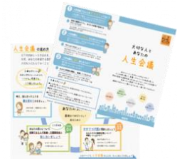
啓発 リーフレット

講義の中で使用する吹田市作成の啓発リーフレット。日々の業務の中でもご活用いただける内容。