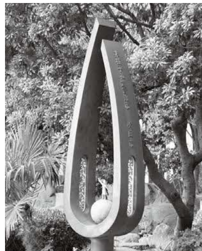
非核平和都市宣言モニュメント