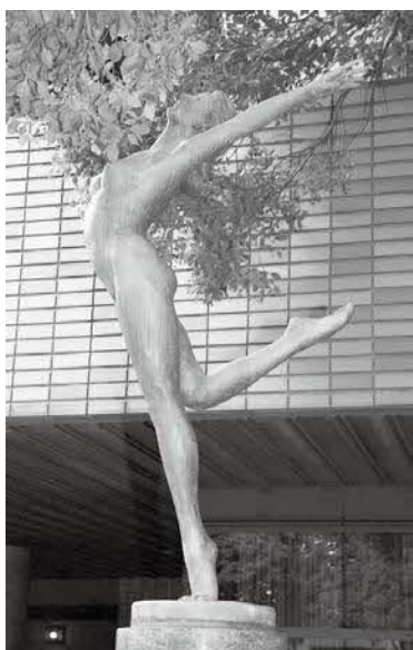
健康づくり啓発ブロンズ像