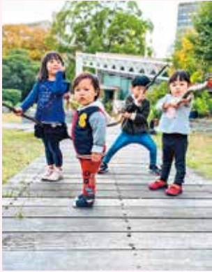
ちびっこ戦隊考上! ゆいれいパパ

江坂公園で、1~5歳の子供たちが戦士や魔法使いになりきっています。思い思いのかわいいポーズをとっています。