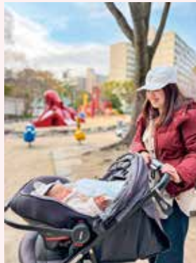
思い出のタコ公園

自分が子供の頃遊んだ公園に、長女を連れて再訪。昔は川があったんだよと教えてあげました。タコは健在。公園も自分も変わった所はあっても、変わらない所もあると感じました。