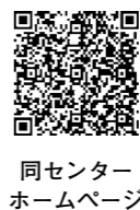
同センターホームページ

市内の保育施設などへの就職を希望する人の相談に、コーディネーターが応じます。申し込み方法など詳しくは同センターホームページへ。時2月17日(出)午前10時～正午。所千里ニュータウンプラザエントランスホール。同センター(保育幼稚園室内)6105・8078 FAX6384・2105。