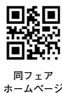
同フェアホームページ

各地区公民館で、講座などの企画や実施・運営をします。会議は月1回程度。◇吹一・吹二・吹三・千一・山一・山三・岸一・岸二・吹田南・南山田・山手・吹田東・西山田・片山・東佐井寺・北山田 任期は6月から2年間。◇北千里 任期など詳しくは、まな