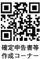
確定申告書等作成コーナー

パソコンやスマートフォンを使って、国税庁ホームページ内「確定申告書等作成コーナー」から申告できます。e-Taxの利用にはマイナンバーカード*か、税務署やJEC日本研修センター江坂で発行できるIDとパスワードが必要です。運転免許証などの本人確認書類を持参してください。これまでに税務署で確定申告書を作成した人は、すでにIDとパスワードが発行されている場合があります。申告書の控えなどで確認してください。 ※電子証明書が有効なもの。暗証番号が必要。