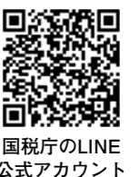
国税庁のLINE公式アカウント