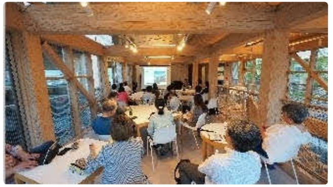
休憩所・フリースペース