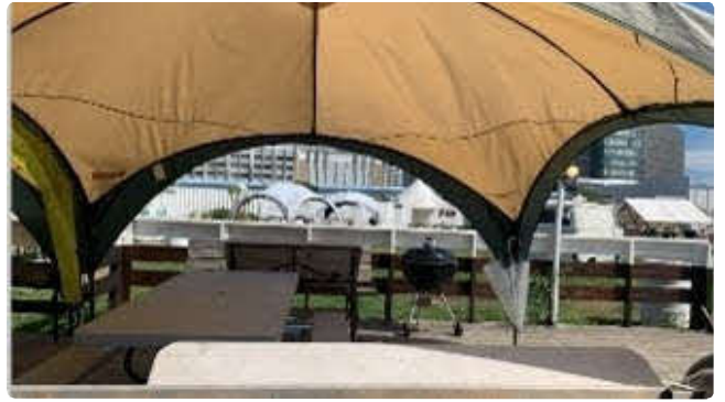
有料バーベキュー場