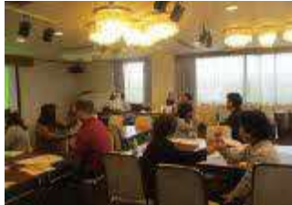
事業所の職員の方向けの研修