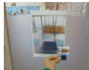
事業所内の環境設定や、活動の見通し表の作成