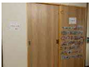
余暇時間の中で使える課題の作成や、遊べるおもちゃのリスト作り