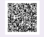
関係フェスティバルのページ