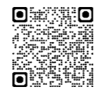
メイシアター ホームページ

次世代を担う若い音楽家がエネ ルギッシュな演奏を披露。吹田ゆ かりの現役音楽家5人が審査員を 務めます。申12月17日(日)午後1時 〜5時30分。所メイシアター大 ホール。¥500円。申11月12日(日)か ら申し込みフォームか、電話でメ イシアター(TEL6386・633 3 FAX6330・7230)へ。