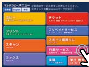
1 「行政サービス」を選択