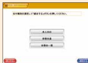
5 「証明書の内容」を選択