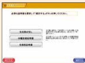
4 同カードの暗証番号を入力し、カードを外した後、「必要な証明書の種類」を選択