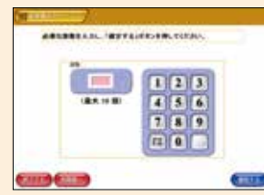
6 必要な枚数を選択し内容確認後、手数料を入金し、証明書を取ってください

※マイナンバーカードを受け取った当日や利用者証明用電子証明書を発行・更新した当日、市外からの転入届を提出した当日は利用できません。翌日以降に利用してください。また、同じ住民票の中に転出予定の人が含まれる場合や、戸籍届の処理を行っている場合など、システムで処理中の証明書は取得できません。