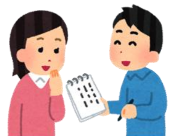
ひつだん かいわ 筆談で会話

めーる メール kyufu-shogai@city.suita.osaka.jp