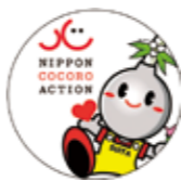
すいたんとシンボルマーク

「こころサポートー」とは、家族や同僚など身近な人に対して、傾聴を中心とした手助けをする人のことです。講座では、メンタルヘルスの基礎知識や、人の悩みを聴くスキルを学びます。時10月26日(休)午後1時30分～4時。所メイシアター中ホール。定先着40人。目あり。申10月20日(金)までに基本事項と手話通訳希望の有無を直接か電話、ファックスで障がい福祉室(TEL6384・1348 FAX6385・1031)へ。