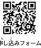
申し込みフォーム