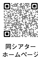
同シアターホームページ

屋外で「アダムスファミリー」(アニメ版)を上映します。日本語字幕・日本語吹き替えあり。 10月8日(日)午後6時から。雨天時は翌日に延期。