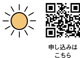
申し込みはこちら

再生可能エネルギーの普及のために開催。ベランダに設置できるほどの大きさの太陽光発電装置を組み立てます。時11月5日(日)午前10時～正午。所千里丘市民センター。定10人。多数抽選。料1万5000円。申10月13日(金)までに申し込みフォームか、基本事項を、はがきでアジエンダ21すいた事務局(〒54・8550住所不要環境政策室内TEL6384・1782 FAX6368・9900)へ。必着。