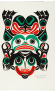
スクリーン版画「カエル」 制作：リチャード・ハント (1980年)

北西海岸先住民のユニークな版画から、彼・彼女たちの共生の世界観や体験した社会変化を紹介します。時12月12日(火)まで。午前10時～午後5時。入館は午後4時30分まで。¥580円。大学生250円。高校生以下無料。所間同館(TEL)6876・2151 FAX)6875・0401)。