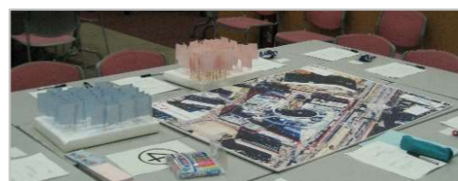
旗と航空写真パネル