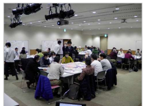
ワークショップの様子