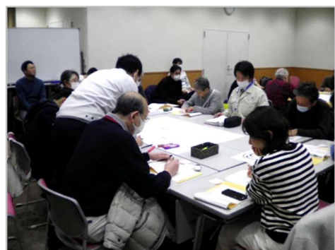
班ごとに振り返り