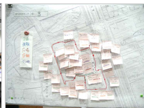
まちの課題を抽出