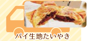
パイ生地たいやき