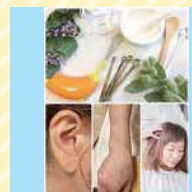
ヘッドスパ・ 耳ツボ など