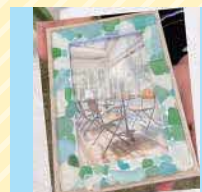
フォトフレーム・ タフティングラグ