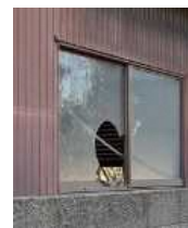
窓が割れた 管理不全空家