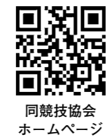
同競技協会ホームページ

中学生以上で、日本陸上競技連盟に令和5年度登記登録している人。¥1種目800円。高校生500円。中学生300円。☎9月20日(水)~27日(水)に所定の用紙を同競技協会へ。☎体育協会。