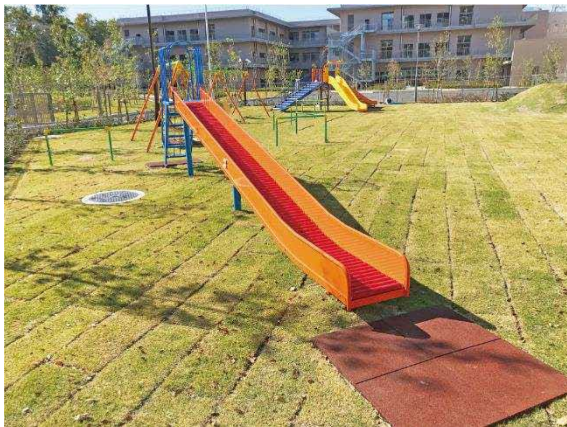
C案：ショートスライダー2基 約2000万円