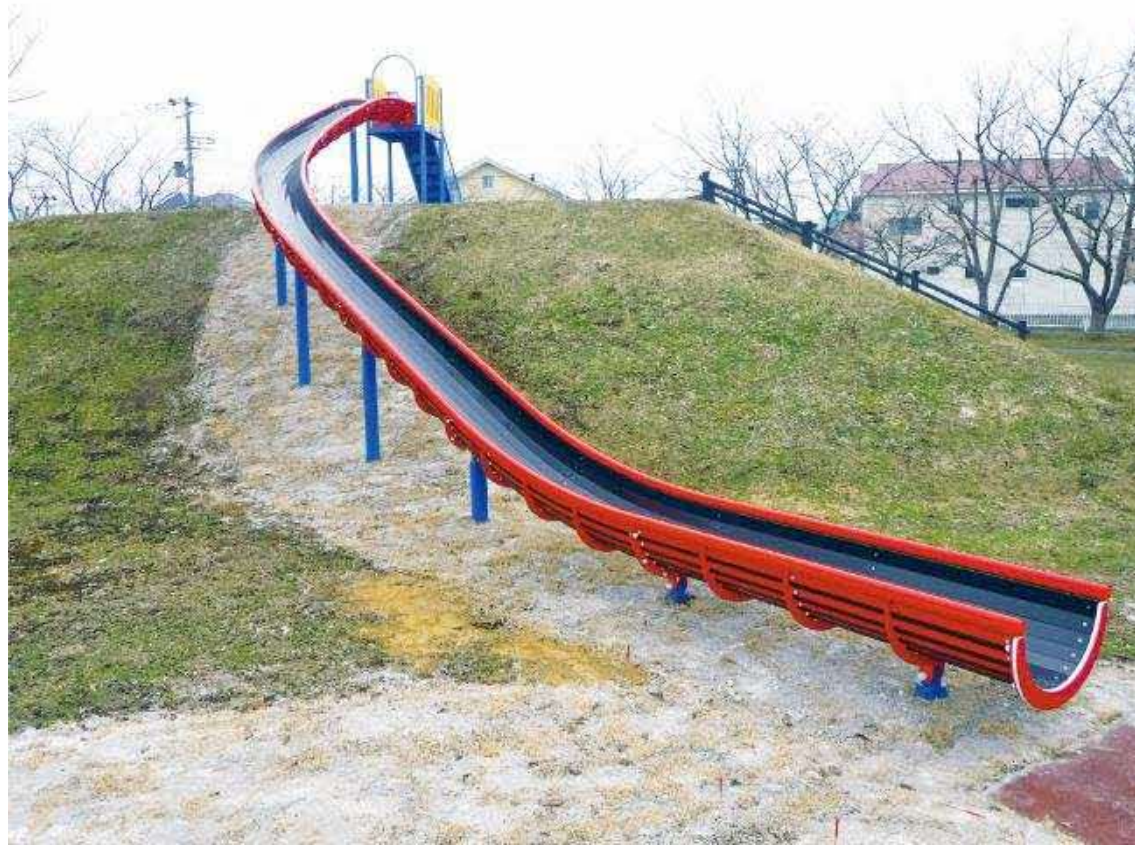
A案：ロングスライダー1基 約1500万円