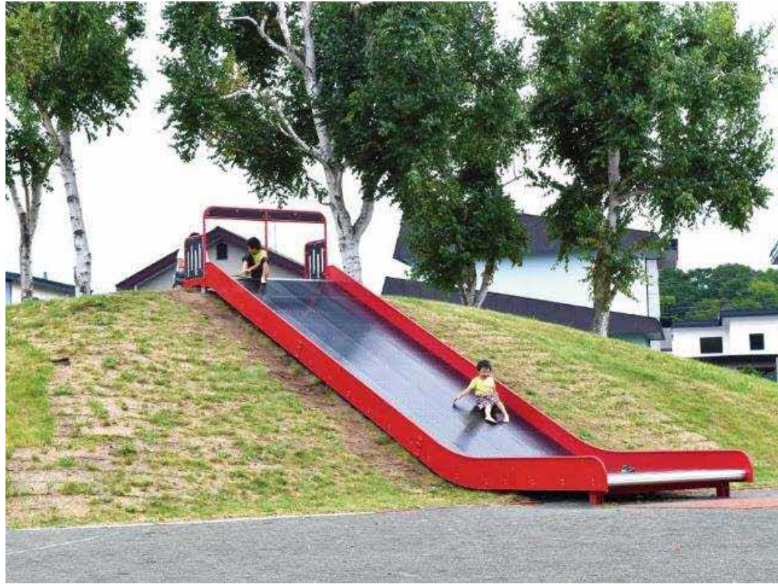
B案：ワイドスライダー1基 約2000万円