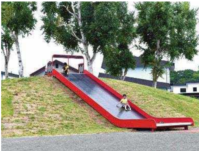
B案：ワイドライダー1基 約2000万円