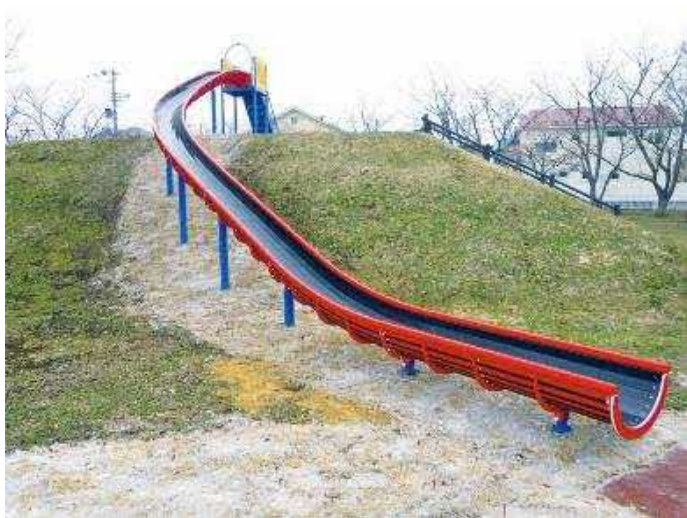
A案：ロングライダー1基 約1500万円