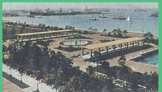
横浜市の山下公園(震災時の瓦礫を埋め立てて造られた)

災害救護に当たっては、現代で言うボランティアとも言うべき住民同士の助け合いや、海外を含む遠隔地からの支援が大きな役割を果たしたことが知られています。