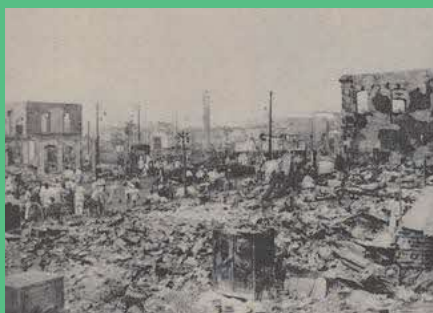
現銀座四丁目交差点付近の焼跡(東京市「東京震災録」)