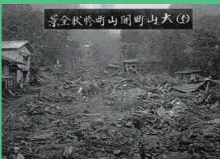
神奈川県中郡大山町(現伊勢原市内)で9月15日に発生した土石流災害

また、発生時刻(11時58分)が昼食の時間と重なったことから、多くの火災が発生し、大規模な延焼火災に拡大しました。関東大震災により全半潰・消失・流出・埋没の被害を受けた住家は総計約37万棟のぼり、死者・行方不明者は約10万5000人に及びました。