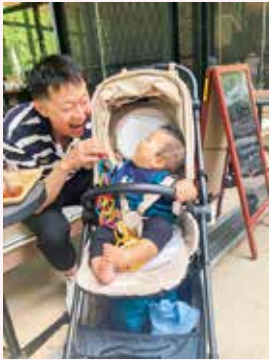
お外で朝ご飯 みなとママ

週末、江坂公園内のカフェにて。いつもと違う場所での朝ご飯に、生後8か月の息子は大喜び。パパも息子が笑顔でうれしそう。