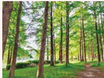
新緑のシャワー コバのぶら歩き

新しくなった桃山公園の中にある春日大池を一周しました。「ラクウショウの林」は遊歩道が整備されていて、見上げると新緑のシャワーを浴びているようで、気持ちすがすがしくなります。