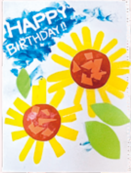
パパへのサプライズ さやママ

パパの誕生日に娘と二人で作りました。3歳の娘が青色をぬったり、花びらを切ったり貼ったりしてくれました。のりを付けすぎてテカテカですが「それも頑張った証ですてき！」と思うのは親バカでしょうか。