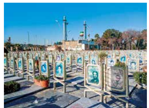
共同墓地に埋葬された殉教者たち(2019年)