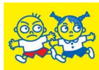
子ども110番の家はこのデザインが目印

の通報などを行います。 家庭や地域で 「一人で遊ばない」「知らない人についていかない」「外出時は防犯ブザーやホイッスルを持つ」など、子供たちに犯罪から身を守る方法を教えましょう。「子供の様子をうかがう」「車から子供に話しかける」などの不審者を見かけたら、子供を守り、すぐに警察に通報しましょう。