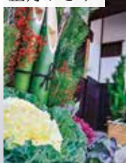
新年は門松などの正月飾りが登場