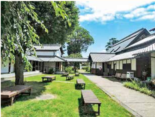
江戸時代の庄屋屋敷を改修した建物。見学や貸室、市民の交流の場として利用されています

吹田歴史文化まちづくりセンターとして開館した「浜屋敷」は、今年6月に20周年を迎えました。記念イベントの開催も予定しています。