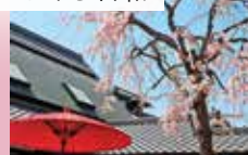
桜の下でのんびりしませんか