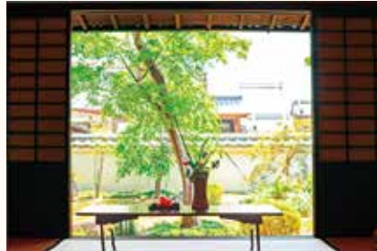
風情豊かな和風庭園も

吹田歴史文化まちづくりセンターとして開館した「浜屋敷」は、今年6月に20周年を迎えました。記念イベントの開催も予定しています。