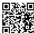
浜屋敷ホームページ