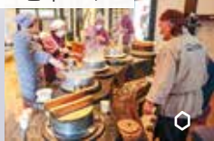
かまどで炊いた七草がゆが来場者にふるまわれます