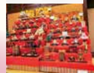
市民から寄贈されたひな飾りを展示