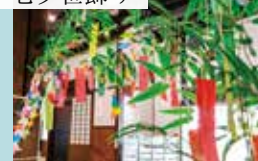
願い事を書いた短冊を笹に飾ります