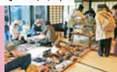
手づくり作家の作品が和室や庭に並びます