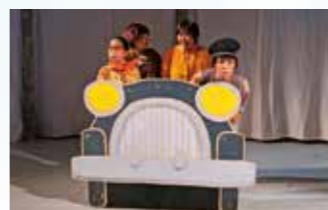
夏休み子供劇場「モモ」

8月3日(休)午前10時30分〜11時40分、午後1時〜2時10分。所メイシアター中ホール。対小学生以下と保護者など。定各480人。多数抽選。申7月3日(月)午前10時〜7月14日(金)午後5時に、基本事項と代表者の名前(ふりがな)、希望時間、子供と大人の人数、子供の年齢をファックスで青少年室(〒565・0824山田西4・2・43 電6816・9890 電6816・8554)へ。