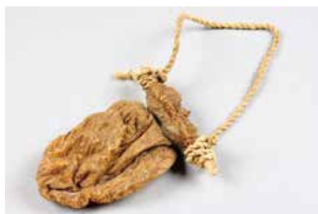
キリンの胃袋でできた狩猟用水筒

世界各地のハンターの生きざまを通して、人と動物、人と人との関わり方を紹介します。 時 7月6日(木)～8月8日(火)午前10時～午後5時。入館は午後4時30分まで。 料 580円。大学生250円。高校生以下無料。 所 岡同館(☎6876・2151 FAX6875・0401)。