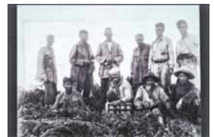
クロッカー山初登頂の瞬間(1932年)

生命科学・物質科学・情報科学など、最先端の基礎工学の世界に触れてみませんか。Zoomでのオンライン開催。 ア 8月2日(水)～4