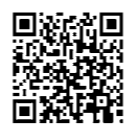
同省ホームページ