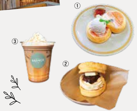
①メープルホイップパンケーキ (980円)、②あんバタークリームパンケーキサンド (680円)、③キャラメルラテ (550円)