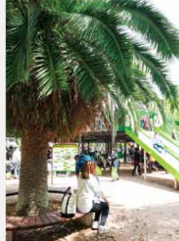
子供が遊び姿を日陰から見守れる 大きな木のサークルベンチ