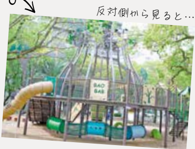
反対側から見ると...