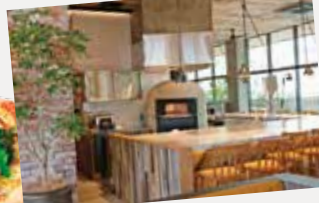
ピザは石窯でわりっと焼き上げ

みんなでシェアできる直径25cm以上の「自家製ブッラータチーズの王様のピザ」(1880円)