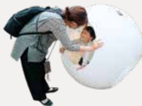
タマゴの中に入ってみよう