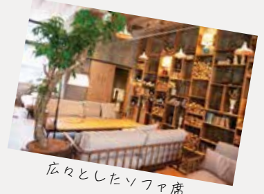
広々としたソファ席

緑に囲まれたロケーションで、開放的なテラス席での食事気持ちいい。タパスやピザ、メイン料理、デザートなどメニュー豊富で、ランチからディナーまで幅広いシーンで利用できます。中でも注目は、併設のチーズ工房で作る自家製チーズを使ったメニュー。トイレには、おむつ交換台やベビーチェアもあり子連れにも配慮。店内88席、テラス72席。午前11時～午後11時。年中無休。☎TEL6155・8991