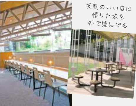
天気の良い日は 借りた本を 外で読んでも