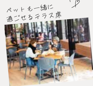
ペットと一緒に 過ごせるテラス席