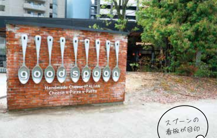
スプーンの看板が目印