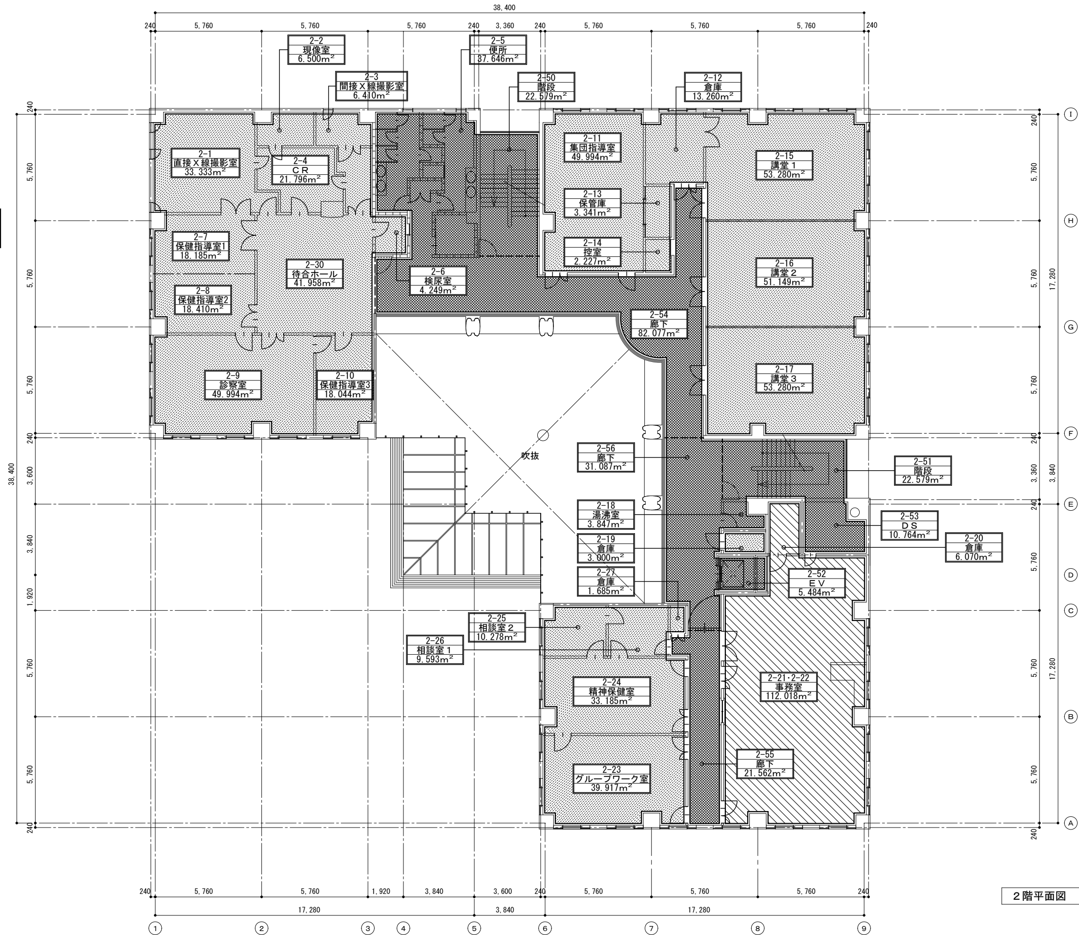
2階平面図 S=1/200 (A3)