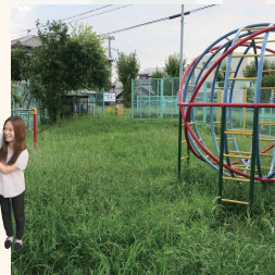
南吹田くるくる第2遊園（南吹田2丁目）