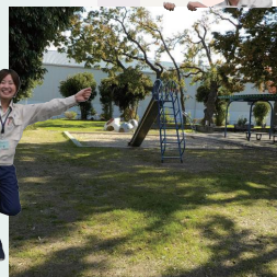
下新田公園（南吹田5丁目）