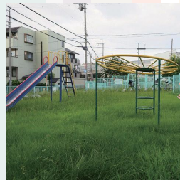
南吹田くるくる遊園（南吹田2丁目）