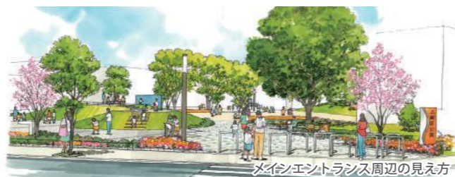
メインエントランス周辺の見え方