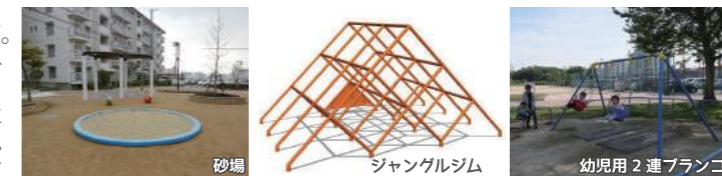
※砂場は、犬猫の糞等の課題があるため、自治会と協議の上、別の遊具に変更することがあります。

土の広場の北側に配置します。人気のある砂場や、ジャングルジム、子育て世代から設置要望の多かったブランコを設置します。