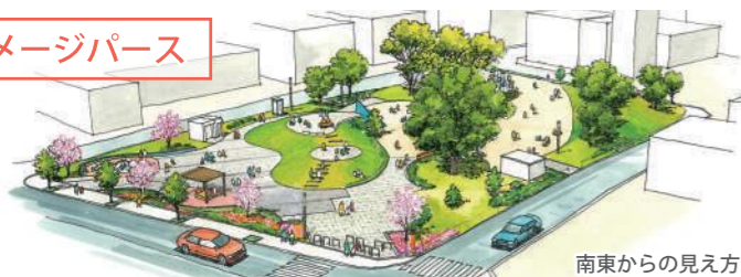
南東からの見え方