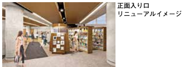
正面入り口 リニューアルイメージ

施設の改修工事のため休館していた同館が4月20日(木)に開館します。フロアが広がり、閲覧席が増えます。パソコンを持ち込んでの調べ物や飲食が可能なスペース、読み聞かせスペース、授乳室、江坂公園へ直接行き来できる出入り口を新たに設けます。同館(TEL 6385・3766 FAX 6385・3945)。