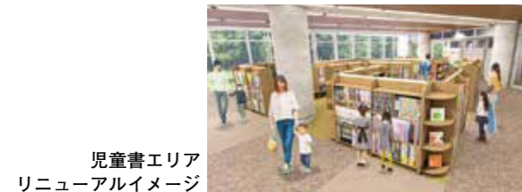
児童書エリア リニューアルイメージ