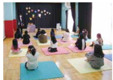
以前に開催した、イベントの様子