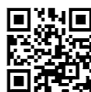
同プラザホームページ

体験型連続講座を通して身近な環境問題や取り組みについて学び、市民研究員をめぐります。運時6月～12月。9回。所同プラザなど。定先着25人。¥3000円。申4月15日(出)から基本事項をファックスで同プラザへ。同プラザホームページからも可。