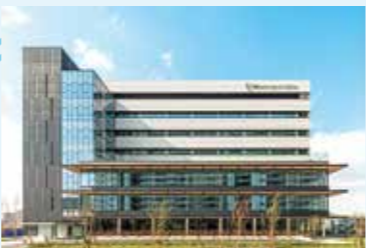
健都イノベーションパークNKビル