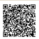
市庁舎ギャラリー

市役所内の壁面を利用し、市民団体の絵画・写真などを展示。開庁時間に見ることができます。