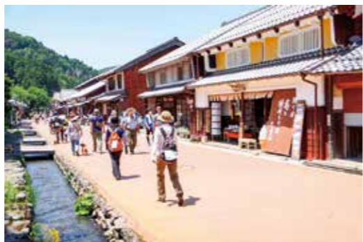
歴史を感じるコースや自然を満喫できるコースを歩きませんか

福井県若狭町 若狭・三方五湖ソーデーマーチ 鯖街道・熊川宿コースと三方五湖周遊コース。随5月20日(出)、21日(日)。¥2500円。中学生以下1000円。申4月17日(月)までに所定の用紙を若狭・三方五湖ソーデーマーチ実行委員会(若狭町観光商工課内TEL0770・45・9118)へ。用紙は市文化スポーツ推進室(TEL6384・1305 FAX)