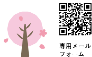
専用メールフォーム

9月3日(日)に万博記念公園で行われる同フェスタの「音楽&パフォーマンス」大道芸フェスの出演者を募集します。申し込みなど詳しくは市ホームページへ。甲5月21日(日)までに同フェスタ実行委員会事務局(シティプロモーション推進室内)☎6384・21