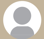
南清和園町 F 氏 (6公園再整備市 民ワークショップ 参加者)

上新田公園と下新田公園について、整備前は雑草がはびこり、木々もうっそうとしていましたが、再整備により公園全体が明るくなり、親子連れの方も利用される良い公園になったと思います。