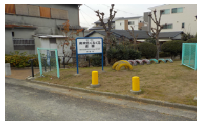
南吹田くるくる遊園