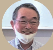
鈴鹿氏 (すいたみどりの サポーターの会)

再整備後の公園で出来るイベントとして、親子連れ等をターゲットにして、どんぐりや竹を利用した工作等をすると思いが上がります。そういった機会があれば是非協力させていただきたいと思います。