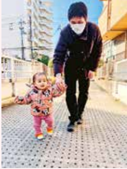
パパの幸せタイム もっちゃん

最近上手に歩けるようになって、パパの手を引いて歩いています。パパは腰を曲げて、うれしそうに手をつないでいました。