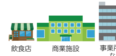
飲食店 商業施設 事業所など