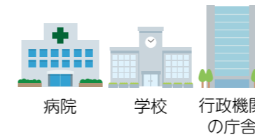
病院 学校 行政機関の庁舎