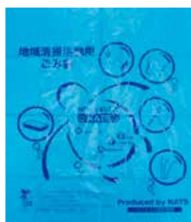
連携してさまざまな取り組みを進めている中核市NATS(西宮市、尼崎市、豊中市、吹田市)のオリジナルデザインごみ袋