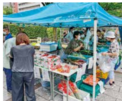
新鮮な地元野菜が並びます

地産地消の取り組みとして、新鮮な旬の地元農産物を販売します。11月13日(日)、12月11日(日)午前9時30分～11時。売り切れしだい終了。所豊津公園。地域経済振興室農業担当(☎6384・1373) ☎4798・5001)。