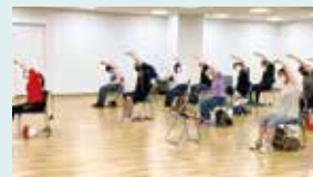
運動機能改善プログラム体験会の様子