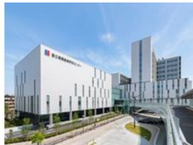
(5) 国立循環器病研究センター