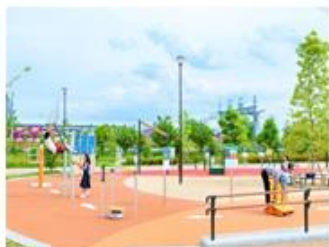
(8) 健都レールサイド公園

JR吹田駅 ⇄ (1)緑の遊歩道 ⇄ (2)JR岸辺駅(北口) ⇄ (3)明和池公園 ⇄ (4)健都イノベーションパーク ⇄ (5)国立循環器病研究センター ★ ⇄ (6)市立吹田市民病院 ⇄ (7)健都ライブラリー ★ ⇄ (8)健都レールサイド公園 ★ ⇄ JR吹田駅