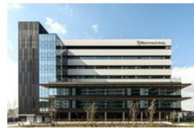
(4) 健都イノベーションパーク