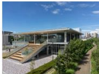
(7) 健都ライブラリー