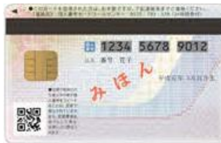
( 뒷면 )