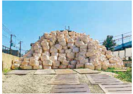
現場に設置された防護壁