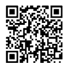
チケット販売サイト

地域発展のためのSDGsへの取り組みや最新テクノロジーの活用について、大阪・関西万博プロデューサーでメディアアーティストの落合陽一さんが話します。☎10月3日(日)午後6時30分〜8時30分。☎メイシアター大ホール。☎先着1100人。☎2000円。☎10月3日(日)までに吹田商工会議所青年部ホームページからチケット販売サイトへ。☎同会議所(☎6330・8001☎6330・3350)。