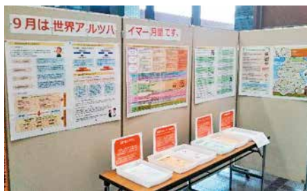
前回のパネル展示の様子

パネル展示 認知症支援に関する取り組みなどを紹介。時所◇9月1日(木)～30日(金) 千里ニュータウンプラザエントランスホール。◇9月20日(火)～30日(金) 市役所正面玄関ロビー。