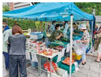
新鮮な地元野菜が並びます

地産地消の取り組みとして、新鮮な旬の地元農産物を販売します。☎9月11日(日)、10月9日(日)午前9時30分〜11時。売り切れしだい終了。☎所豊津公園。☎地域経済振興室農業担当(☎6384・1373☎4798・5001)。