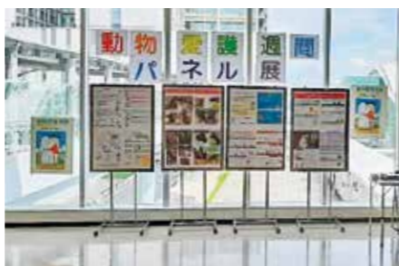
前回のパネル展示の様子

硬いボールやバットの使用は、 周りの人のけがや事故につながる 危険性があるため禁止です。野球 やサッカー、硬式テニスなどは専 用施設があるスポーツグラウンド で行ってください。やわらかい ボールなどで遊ぶときは、家や道 路に向かってボールを飛ばさない ように注意してください。園公園 みどり室(佐竹台1 TEL6834・ 5366 FAX6834・5486)。