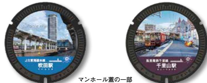
マンホール蓋の一部

各マンホール蓋のデザイン紹介のほか、撮影の裏話をお さめた「鉄道シリーズ COMPLETE BOOK」や、各マンホ ール蓋を模した缶マグネットの配付も。先着順。