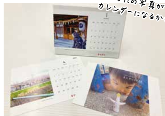
過去のカレンダー