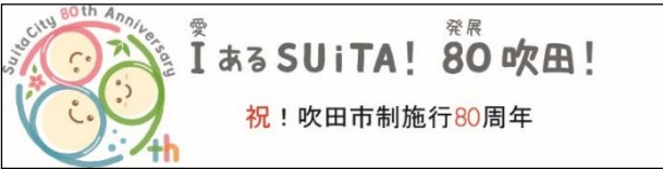
▲こちらは、バナーです。