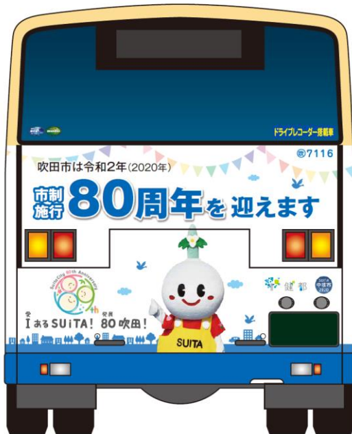
ナンバープレートが右端用デザイン

市内を走る阪急バス3台に後部ラッピングを実施します。12月からの走行開始を目指し調整中です。令和2年4月からは、当該年度用にデザインを変更する予定です。