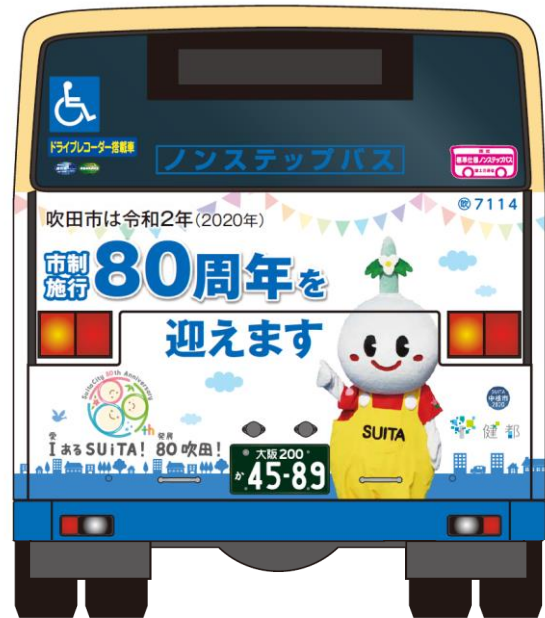
ナンバープレートが中央用デザイン