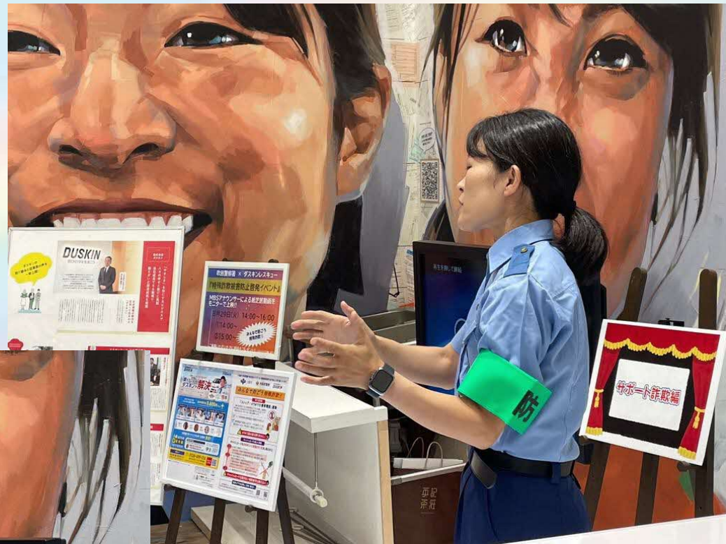
吹田警察署さんによる 特殊詐欺被害防止への注意喚起