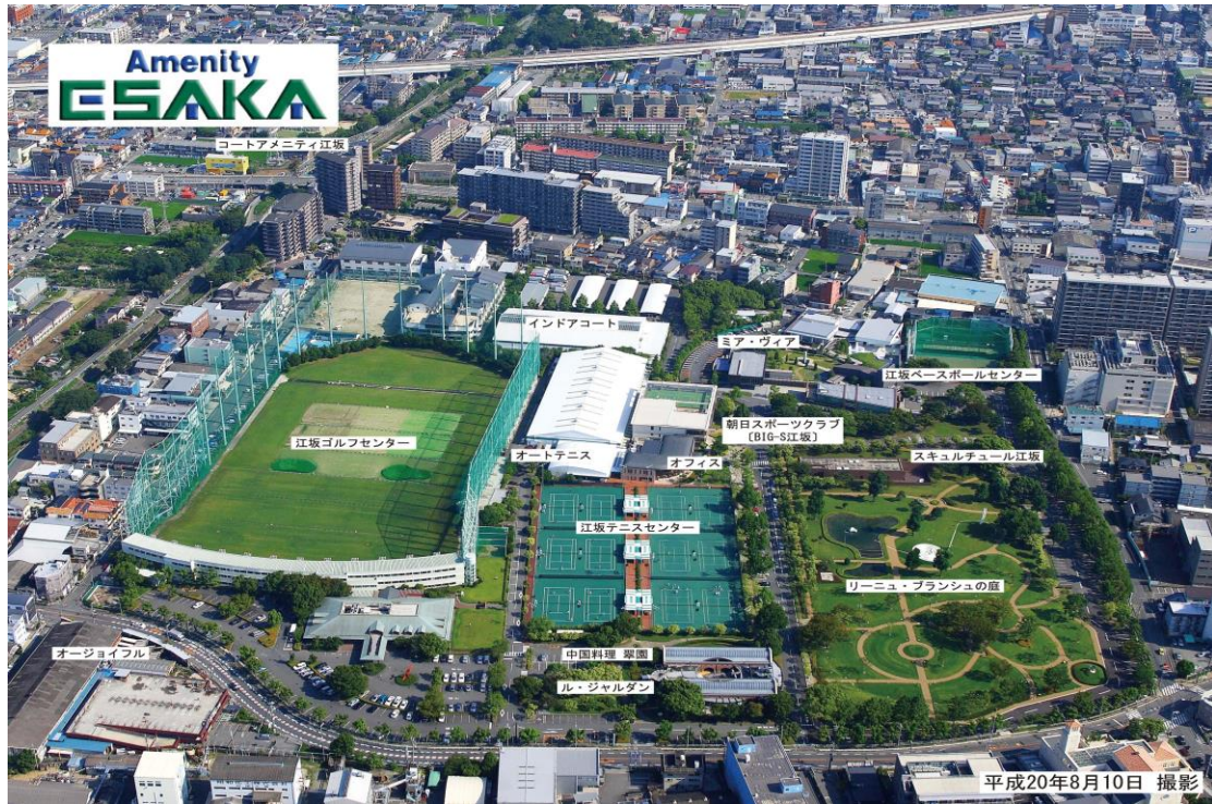
当社運営「アメニティ江坂」の全景 敷地面積：139,215㎡（約42,200坪）