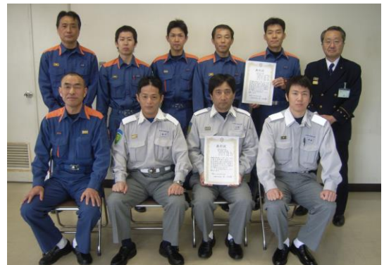
東消防署 第2警備 ポンプ車分隊及び救急隊