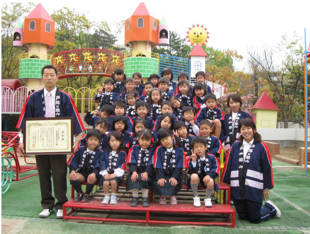
優良消防クラブ表彰 (若竹学園千里幼稚園)