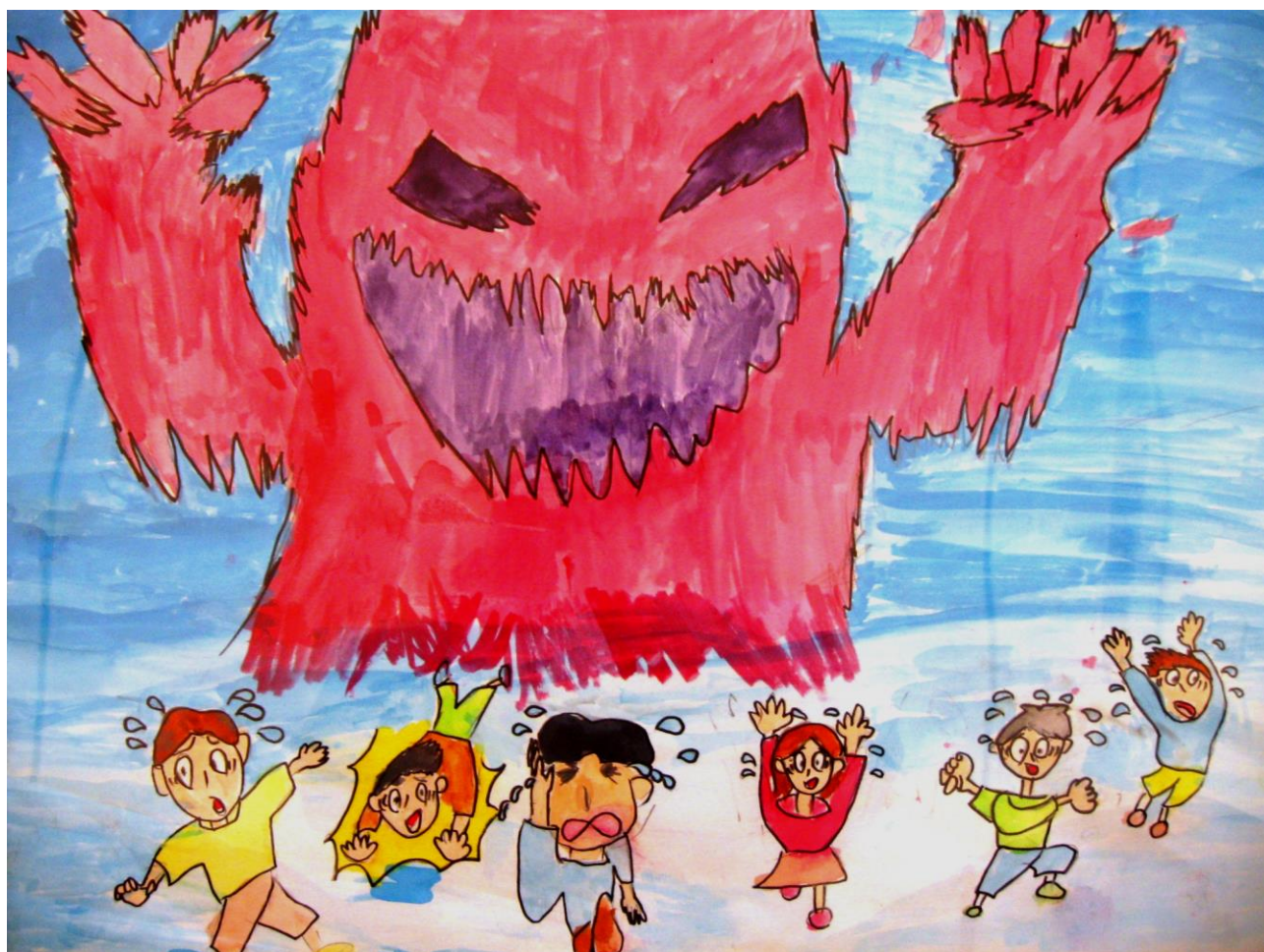
平成22年度防火作品(防火図画の部)