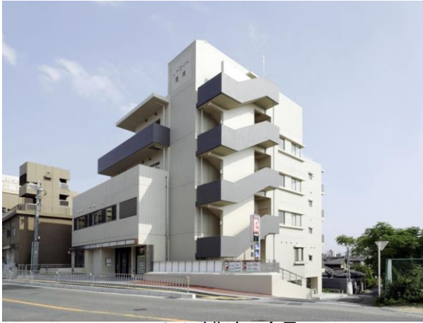
リーサイド豊津の全景