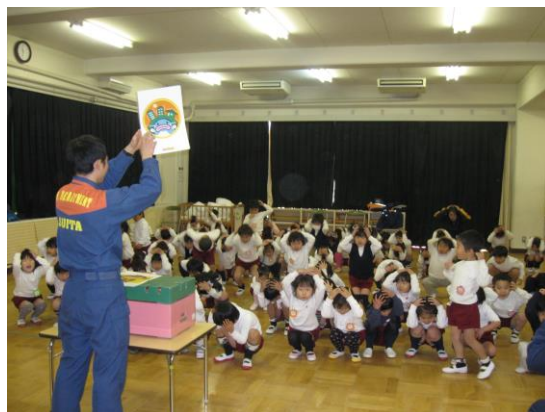
ゲーム中の園児たち

講習会は、避難訓練、点呼、ビデオ視聴に続いて、「ぼうさいダック」が実施されました。「ぼうさいダック」は、幼児から小学生低学年の児童向けの防災教育カードゲームで、子供たちが実際に身体を動かし声を出して遊びながら、防災や日常の危険から身を守ることやあいさつ、マナーといった日常の習慣について学ぶことができるゲームです。