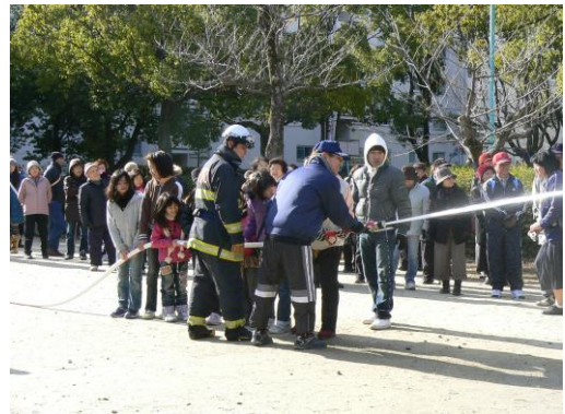
竹見台自治団体協議会の訓練

吹田市では、例年9月に防災関係機関が参加した地域防災総合訓練を実施していますが、地域での防災意識が高まる中、吹田市自治会連合協議会から「地域主体の防災訓練を」という提案があり、昨年を引き続き、避難訓練や情報収集伝達訓練に加えて、要援護者等の安否確認訓練などのほか、自主的な取り組みとして、炊き出し、消火器の取扱いやAEDを用いた救急講習などを行った連合自治会もありました。