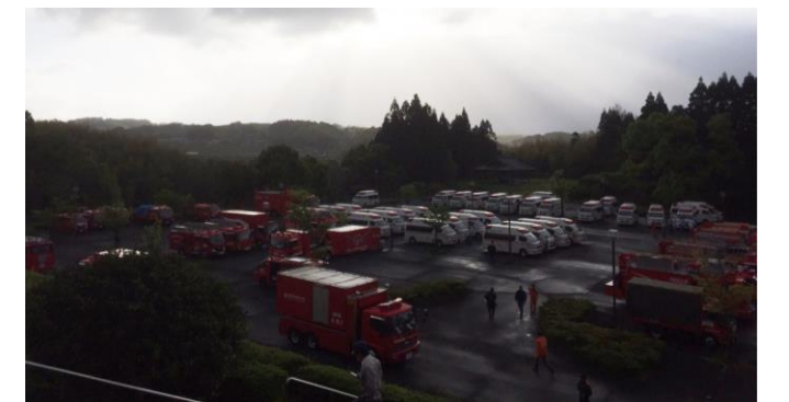
宿营地（菊池市総合体育館）