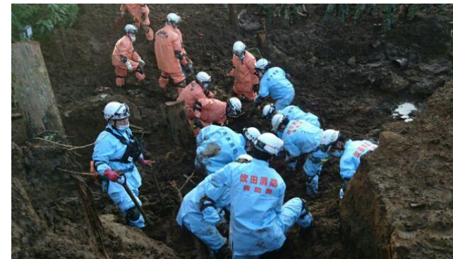
活動状況（南阿蘇村高野台団地）