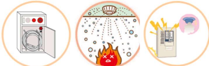
屋内消火栓設備 スプリンクラー設備 自動火災報知設備

建物に設置義務のある消防用設備（屋内消火栓設備、スプリンクラー設備又は自動火災報知設備）が設置されていない重大な消防法令違反です。