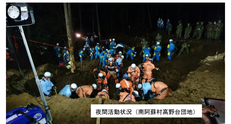
夜間活動状況（南阿蘇村高野台団地）