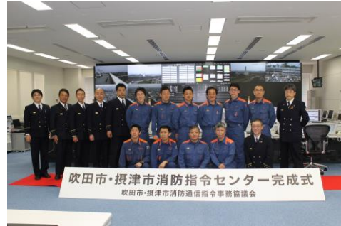
吹田市・摂津市消防通信 指令事務協議会のメンバー

吹田市内からも摂津市内からも当指令センターに通報が入り、出動指令を対象署所へ流します。災害現場での速やかな相互応援体制を確立しています。