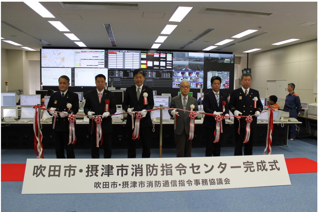
吹田市・摂津市消防指令センター完成式(7ページに関連記事)