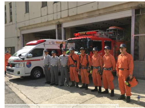
救助隊・救急隊出発

吹田市消防本部では、4月16日から4月23日まで緊急消防援助隊大阪府隊として、救助隊2隊10名、救急隊2隊6名、後方支援隊2隊6名を熊本県に派遣し、主に南阿蘇地区での救助・救急活動を行って参りました。