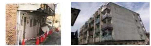
(建物の傷みが著しく外壁の剥落等が生じた事例)