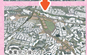
事業完了後のイメージ

2本の都市計画道路や公園と周辺宅地をあわせて整備することにより、良好な市街地を形成します。 【事業予定期間】2020～2035年度