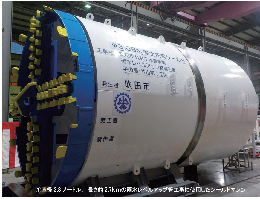
①直径2.8メートル、長さ約2.7kmの雨水レベルアップ管工事に使用したシールドマシン

写真左はInstagram用動画の撮影の様子。右は実際に公開している映像の一枚です。二次元コードからご覧ください