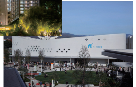
NIFREL (第4回吹田市景観まちづくり賞 屋外広告物部門受賞)▶