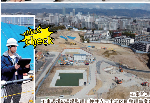
工事現場の現場監理(佐井寺西土地区画整理事業)