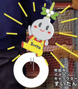
吹田市 イメージ キャラクター すいたん