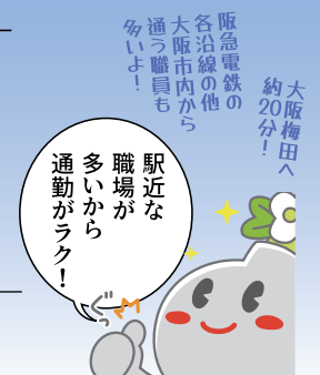
▲市のイメージキャラクター「すいたん」