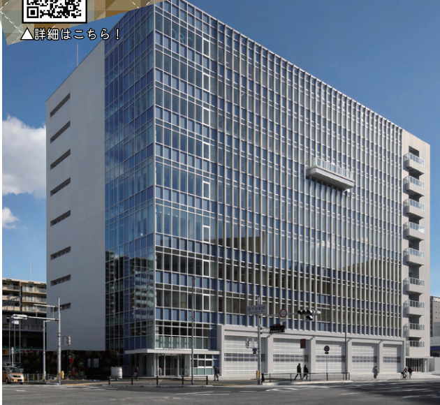
▲吹田市総合防災センター(DRC Suite)に土木部行政機能が移転(令和6年4月)

土木部には4つの室があり、市民サービスの向上や市民が安心して快適に暮らせるまちづくりのために頑張っています。