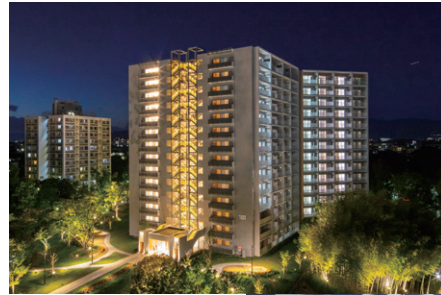
◀千里グリーンヒルズ竹見台 101号棟 201号棟 (第4回吹田市景観まちづくり賞 建築物部門受賞)