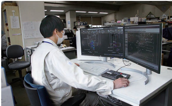
適切な設計・積算も重要な仕事

吹田市の汚水系普及率は99.9%。市では約866kmに及ぶ下水道管の維持管理に加え、古くなった管の修繕、下水処理場も含めた計画的な改築を推進しています。