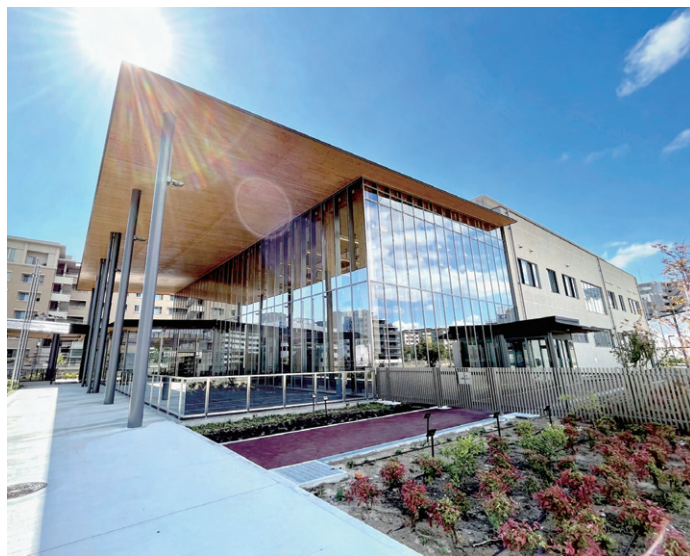
▲まちなかりビング北千里（2022年開館）

小学校跡地に建築した「まちなかりビング北千里」は、児童センター、公民館、図書館の機能を融合した複合施設です。施設の一部は木造で、木のぬくもりにあふれています。さまざまな世代の人たちがここを気軽に訪れ、集い、ふれあいながら、ともに心を育む「まちのリビング」になるような施設を目指しつくりました。私たちは、地域の人たちと話し合いを重ねながら、このような場所をつくる仕事をしています。