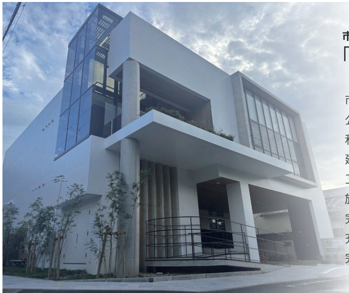
▲吹三地区公民館 及び 吹三地区高齢者いこいの間（2024年開館）