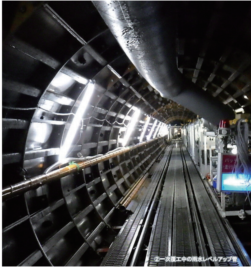
②一次覆工中の雨水レベルアップ管