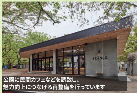
公園に民間カフェなどを誘致し、魅力向上につなげる再整備を行っています