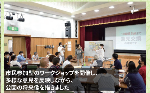
市民参加型のワークショップを開催し、多様な意見を反映しながら、公園の将来像を描きました