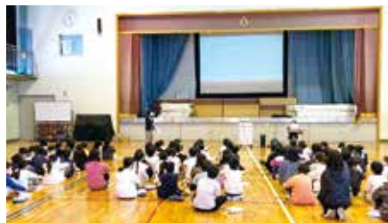
小学生向け防犯出前講座の様子

これからも安心安全に暮らせるまちをめざして、市民のみなさんと一緒に取り組みを進めていきます。